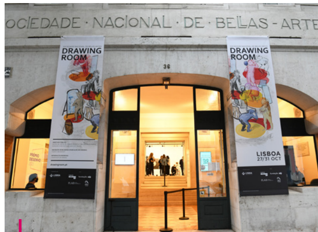
Drawing Room Lisboa 2021

Os trabalhos selecionados foram reunidos em exposição inaugurada a 23 de outubro de 2021, no Pavilhão 31 do Centro Hospitalar Psiquiátrico de Lisboa.