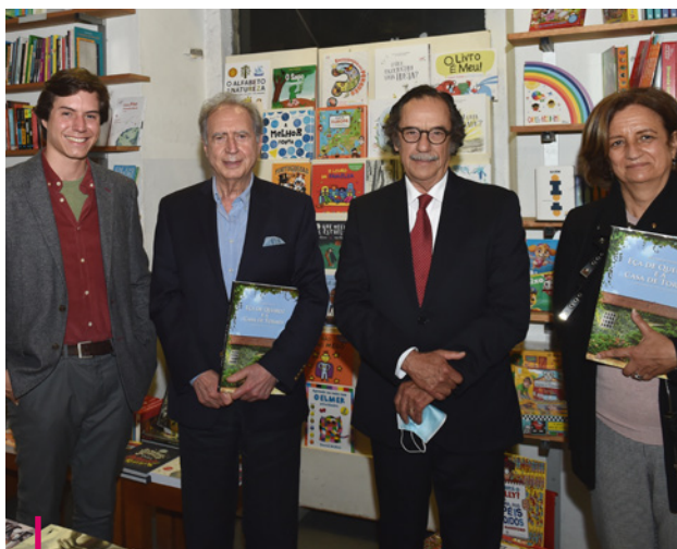
Prémio Literário Fundação Eça de Queiroz/Fundação Millennium bcp