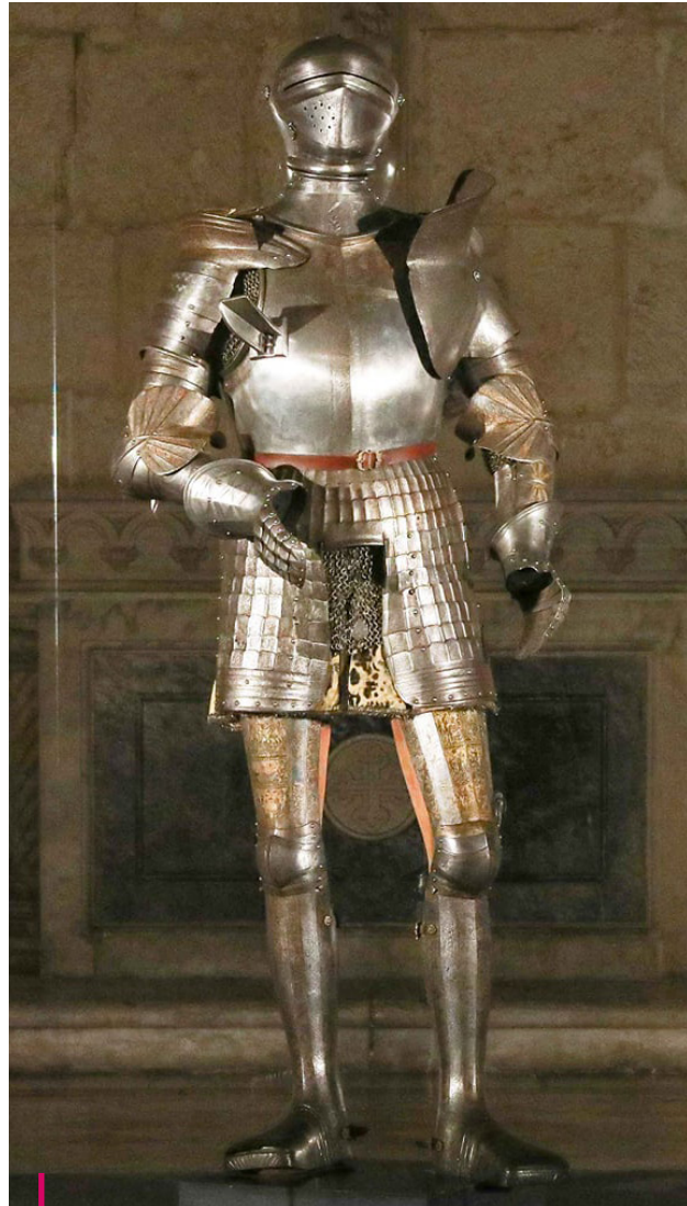
“Luz a D. Manuel nos 500 anos da sua Morte”