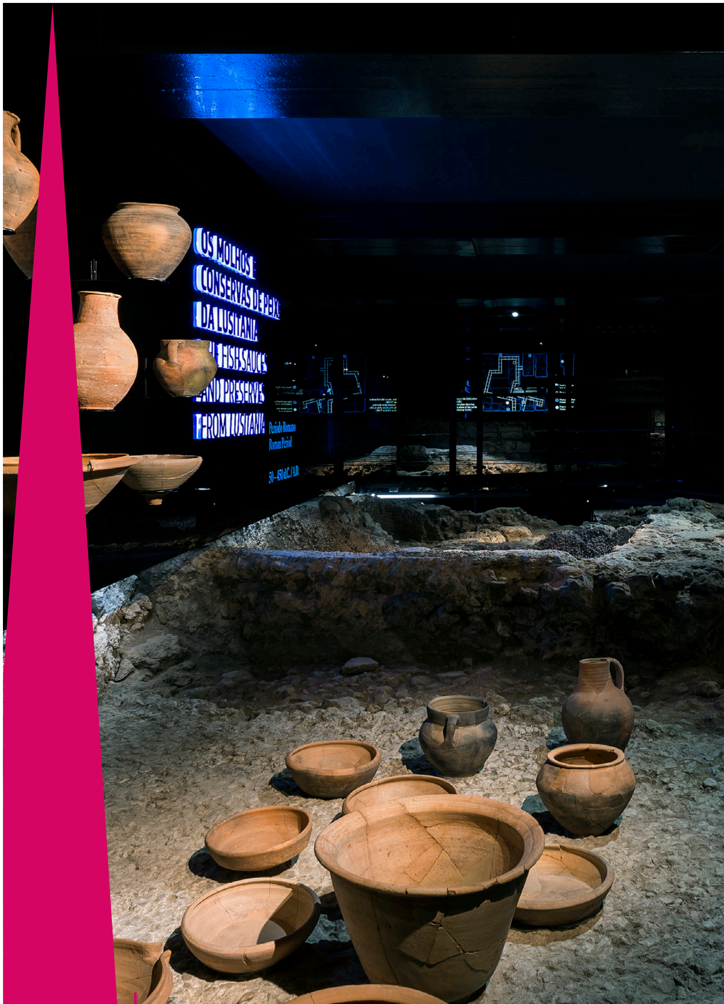
Núcleo Arqueológico da Rua dos Correiros (NARC)