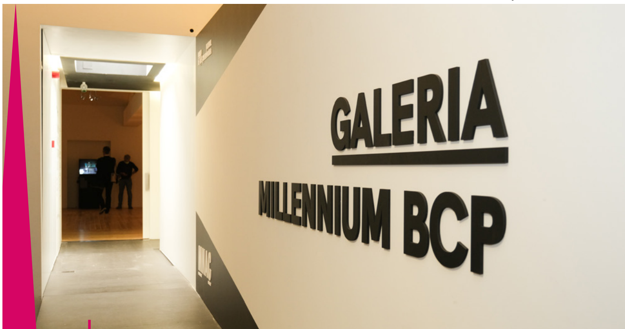
Galeria Millennium bcp

fragilizadas, o que motivou um especial acompanhamento e apoio aos projetos lançados com o intuito de atenuar as carências e as desigualdades que a situação pandémica criou ou acentuou.