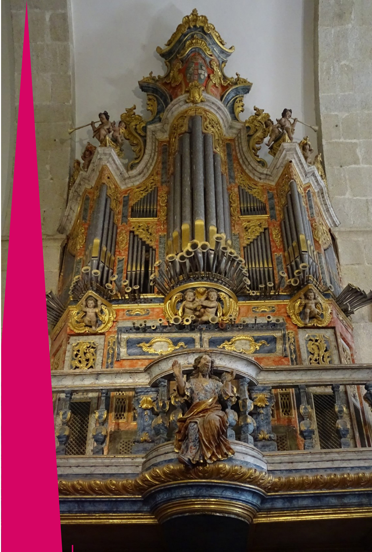
Igreja e Mosteiro de São João de Tarouca